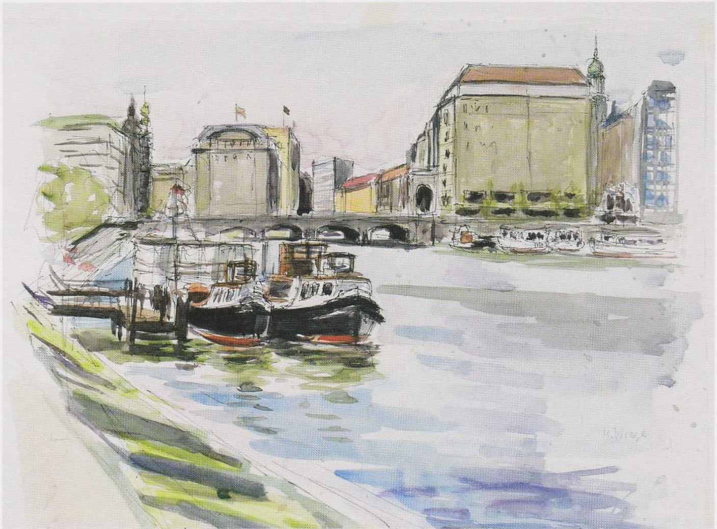
Blick vom Ballindamm auf die Reesendambrücke, 1975