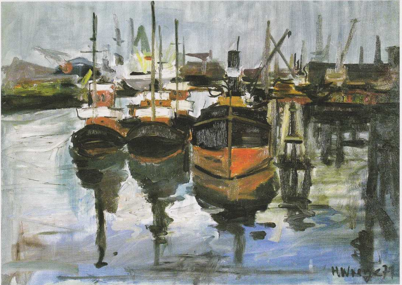
Hamburger Hafen am Reiherstieg, Steinwerder, 1971